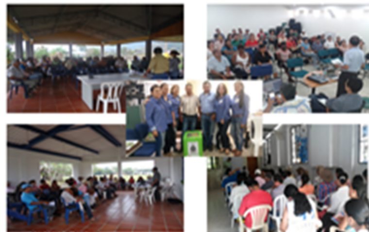
EVALUACION PERFILES DE ALIANZAS